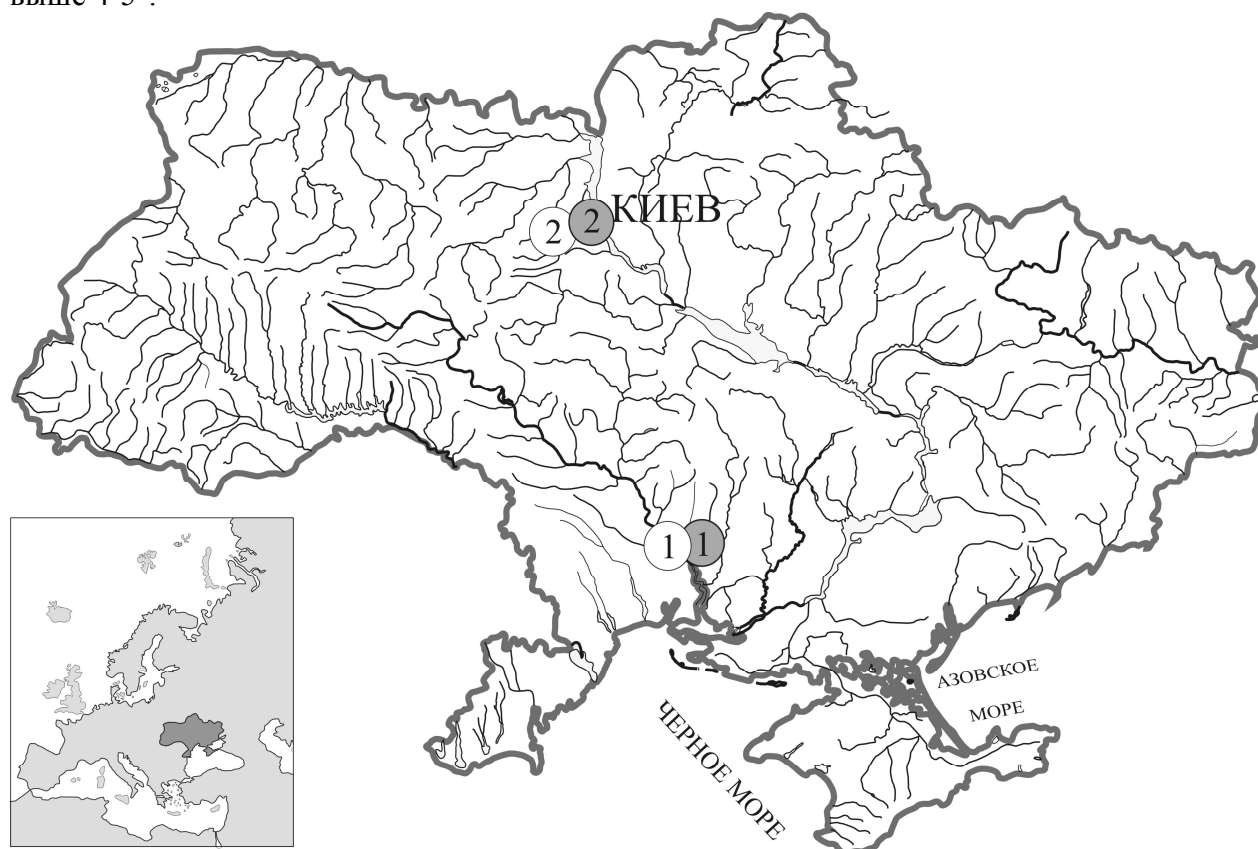
Рис. 1. Стационарные пункты сбора материала: залитыми кружками обозначены точки сбора V. viviparus ; пустыми кружками – V. sphaeridius : 1 – р. Южный Буг, с. Баловное, Николаевская область, Украина; 2 – р. Буча, с. Лесная Буча, Киевская область, Украина.

Моллюсков собирали ежемесячно с июня 2010 года по май 2011 года в пределах стационарных пунктов сбора (рис. 1) с помощью гидробиологического сачка. Сразу после отбора пробы фиксировали 96 % спиртом и затем хранили при температуре не выше 4-5°.